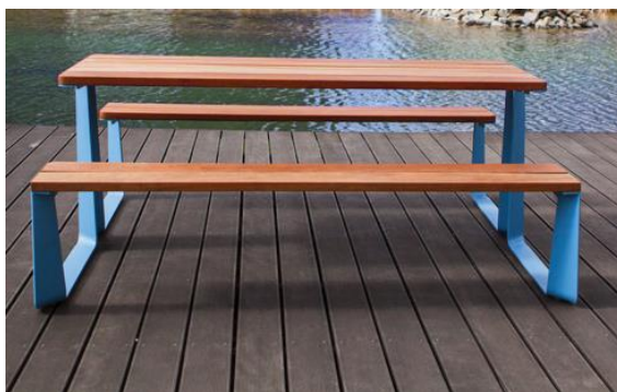
Špecifikácia – set lavičiek a stola – veľký (inšpiračný obrázok)