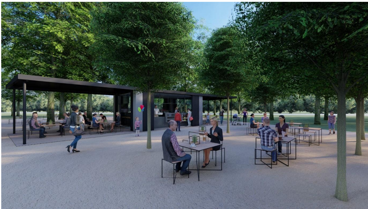
Vizualizácia - hmotové riešenie kiosku (inspiračný obrázok)

Dielenská dokumentácia – lavička parková atyp (SO.2.05)