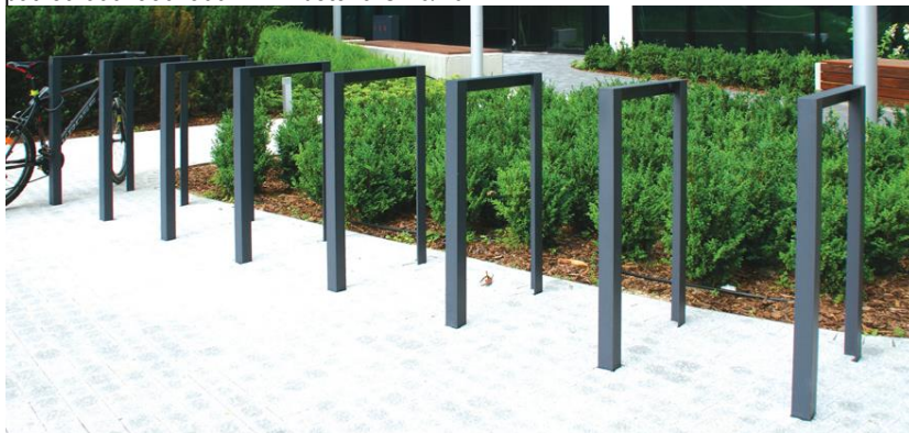
Špecifikácia – stojan na kola (inšpiračný obrázok)

Kotvenie kotviacou pätkou 600x350x300 mm z betónu C 16/20